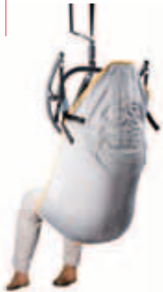
VIP draagband t.b.v. kanteljuk