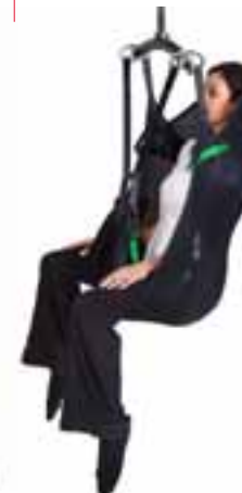
Toilet draagband, optie extra hoofd- ondersteuning